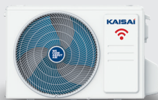
Vonkajšia jednotka KWC